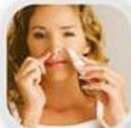
Промывание носа солевым раствором