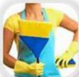
Влажная уборка помещения